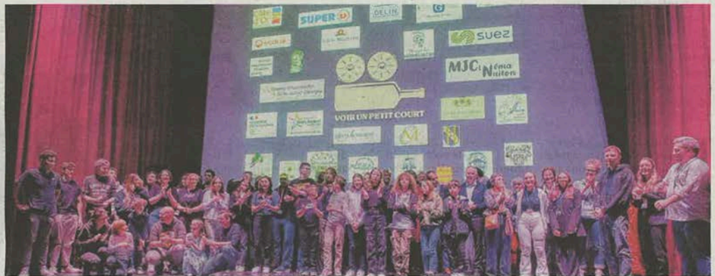
Le jury, les organisateurs et les lauréats réunis sur la scène avant que le rideau ne tombe sur cette neuvième édition de Voir un P'tit Court.

Du côté des candidats amateurs, si dix-sept d'entre eux avaient fait acte de candidature, au final les organisateurs n'ont reçu que douze vidéos. Cette année, les amateurs devaient réaliser un court-métrage de trois à cinq minutes sur le thème "Remake ton film". Les professionnels devaient, quant à eux, proposer un court-métrage de dix mi-