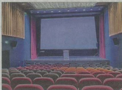
Le festival Voir un petit court aura lieu dans la salle du Cinéma Nuits entièrement rénovée.

Du 6 au 19 février, le comité de sélection a reçu 150 vidéos dans la catégorie professionnelle et n'en a retenu que quinze, dix dans la catégorie "fiction" et cinq dans la catégorie "animation". Du côté des amateurs dix vidéos ont été déposées sur la quinzaine d'inscriptions au départ et seront en lice pour la compétition. Les participants amateurs sont issus d'horizons divers : collège, lycée, centre éducatif ren-