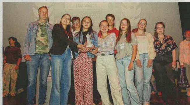
Les élèves du collège Félix Tisserand ont été doublement récompensés.