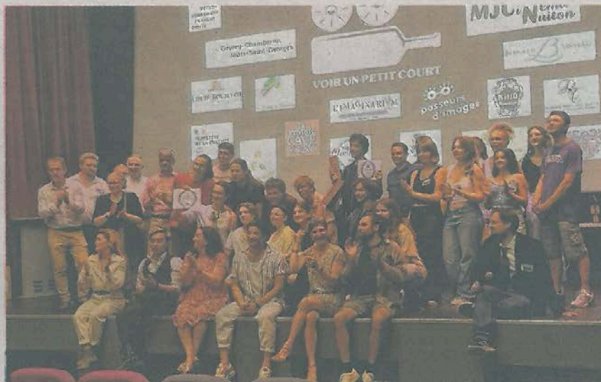
En juin, la cérémonie avait récompensé les amateurs enfants, adultes ainsi que les professionnels.

La neuvième édition 2024 à Nuits-Saint-Georges du festival cinématographique Voir un petit Court est désormais lancée avec l'ouverture des inscriptions pour les catégories amateurs.