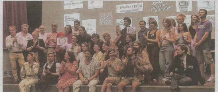
La cérémonie de remise des prix du festival Voir un petit court s'est déroulée ce samedi 3 juin au Cinéma Nuits. Environ 120 personnes étaient présentes.

Dans la catégorie amateurs, le thème était « Remake ton polar ».