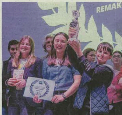
Les élèves du collège Félix-Tisserand, lauréat 2024 en catégorie amateur.

Du côté des amateurs, la compétition se jouera entre 7 vidéos de la catégorie jeunesse et 3 de la catégorie adultes. Pour cette 10 e édition, les candidats amateurs devaient respecter le thème imposé de "Remake un film de 2015".