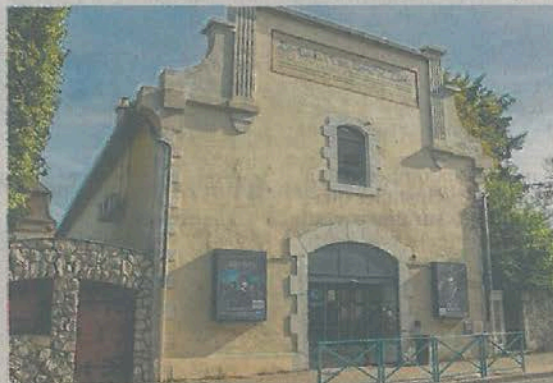
Le Cinéma nuiton accueillera la cérémonie de remise des récompenses qui aura lieu le 4 mai 2024.

● Freddy Bezault (CLP) Site internet https://voirunpetitcourt.fr